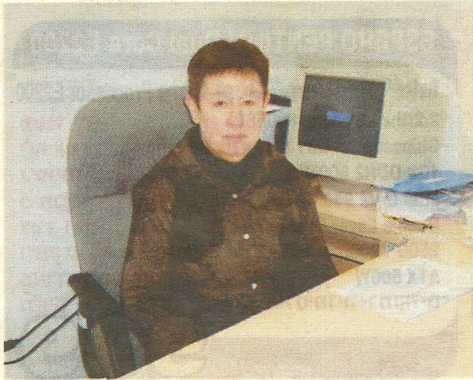
שירות מקצועי ומיומן. שוורץ

המרכז לבריאות הנפש "שער מנשה" הפך למבוקש בקרב מתמחים שמבקשים להגיע אליו מכל רחבי הארץ. והשנה, 100 אחוזי הצלחה ל"בוגרי" המרכז בבחינות המומחיות